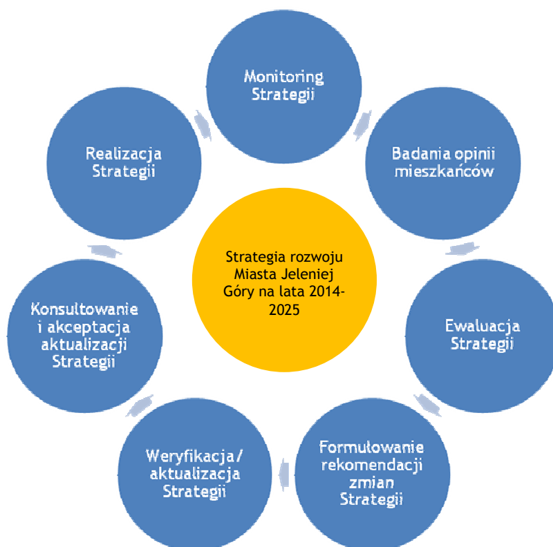
Schemat 1. Cykl zarządzania Strategią

Opracowanie: Jacek Dębczyński, Grzegorz Romańczuk